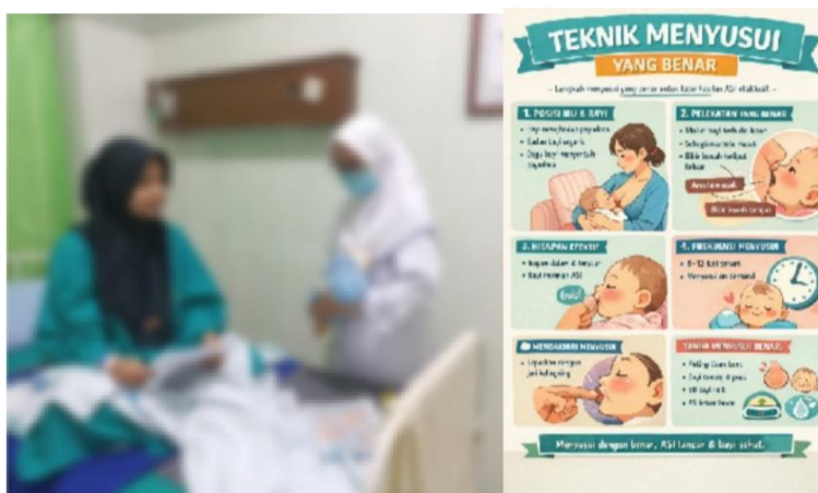
Gambar 3. Dokumentasi Kegiatan

Berdasarkan keseluruhan hasil, edukasi teknik menyusui yang diberikan selama tiga hari terbukti efektif dalam meningkatkan pengetahuan dan keterampilan ibu primipara. Keberhasilan ini dipengaruhi oleh penggunaan metode edukasi yang interaktif, yaitu kombinasi antara media visual (poster), demonstrasi menggunakan phantom , demonstrasi langsung, dan redemonstrasi oleh ibu. Pendekatan ini dapat menjadi salah satu strategi yang direkomendasikan dalam praktek keperawatan maternitas untuk mendukung keberhasilan pemberian ASI.